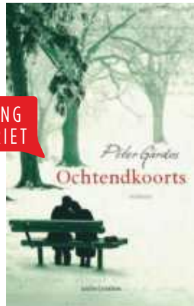
OGHTENDKOORTS, PÉTER GARDÓS, UITGEVERIJ AMBO/ANTHOS